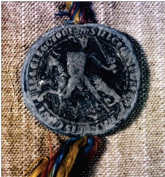
Reverso de un sello de plomo de Alfonso XI de 1333. Número 81 de la colección.

Hay que esperar a la publicación de la obra Privilegios reales otorgados a Toledo... de Ricardo Izquierdo Benito 46 para comprobar la mención de parte de los sellos pendientes, pues este historiador sí recogió la existencia o no de ellos al estudiar los diplomas, con descripciones del tipo “conserva medio sello de cera colgado de una cinta de cuero”, “falta el sello pero conserva los hilos de seda”, “conserva suelto el sello de plomo”, “conserva colgando el sello de plomo”, “ha perdido el sello”... En su obra se refleja de este modo la existencia de treinta y cinco sellos pendientes, en su casi totalidad de plomo 47 . Pero sabemos que hay más.