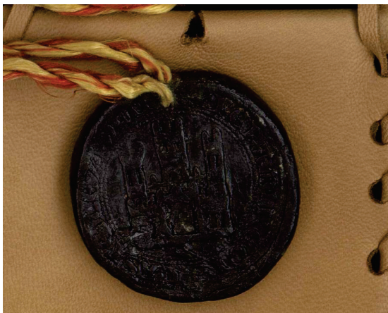
Anverso de un sello de plomo de Fernando III de 1243 después de la restauración. Número 115 de la colección.