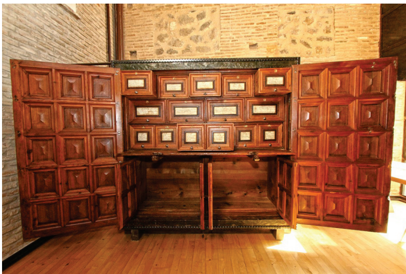
El mueble del Archivo Secreto en la actualidad.

ro de pliegues a los que se someterán los pergaminos. Los que no habían perdido sus sellos los conservaban unidos con sus cintas, cordones e hilos protegidos generalmente dentro de la plica o dobléz del pergamino del que pendían, casi en su totalidad en legajos distribuidos por los diferentes cajones del archivo-secreto, pues las alacenas custodiaban fundamentalmente documentos en papel. El mueble estaba protegido por una puerta de madera recubierta de una superficie metálica y dotada de seis cerraduras. Además para acceder a la habitación en la que se encontraba era preciso atravesar otra puerta dotada también de tres cerraduras.