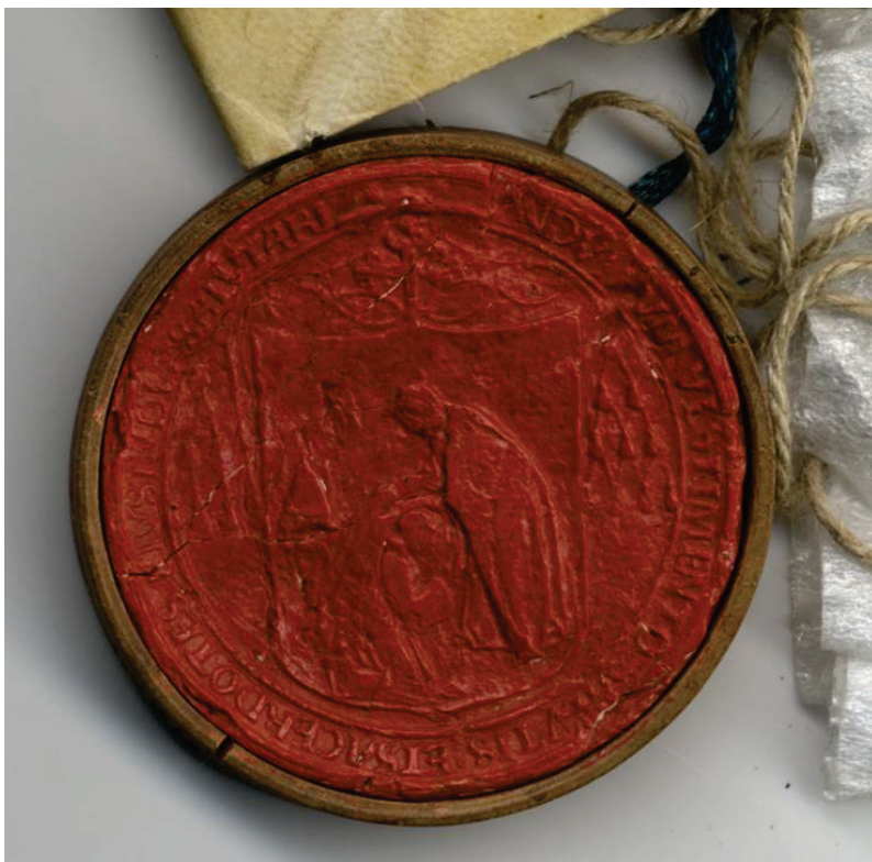
Sello de cera de un canónigo de la catedral de Toledo del año 1518.

Todavía nos quedan tareas por hacer y es posible que la colección se incremente con nuevos ejemplares al conservarse fragmentos de varios sellos pendientes aún sin identificar. Es factible la realización de trabajos de restauración sobre cincuenta de ellos que no han sido tratados por los técnicos del IPCE y, en todo caso, es preciso abordar una mejora en su instalación dotando a todos de las bolsas de protección ya mencionadas. Además es muy importante la difusión entre los ciudadanos de esta colección y este texto inicia ese camino que queremos profundizar en los próximos años.