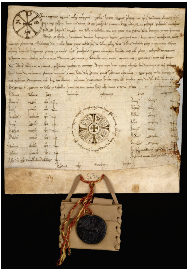
Privilegio rodado de 23 de enero de 1222.

nes a la largo de los siglos pero habría bastado un simple descuido o un leve periodo de falta de control para que todos los sellos hubieran desaparecido a manos de un coleccionista o fueran destinados a otros usos menos personales. Esto ocurrió en casi todas las poblaciones castellanas, pero Toledo es una dichosa excepción. Los archiveros toledanos que continuaron la tarea de los regidores archivistas no separaron los sellos pendientes de sus pergaminos y así, sin amputaciones, se conservan muchos de ellos en la actualidad.