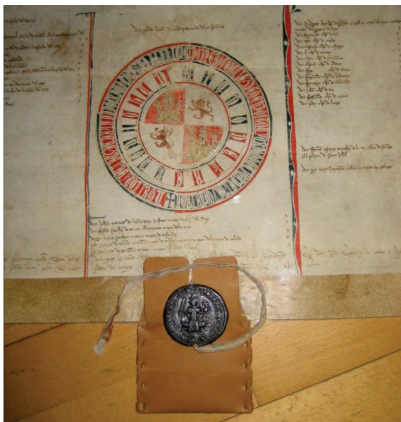
Anverso de un sello de plomo de Enrique II de 1371 conservado en una funda de piel.

cada documento, con sello restaurado, fue introducido dentro de una funda de mylar o melinex, que tenía incorporado un cartón de conservación para dar al conjunto más consistencia. Fuera de la funda plástica permanece el sello colgante en su bolsa de protección. Esos documentos, en grupos de menos de diez, han sido incluidos en carpetas especiales realizadas con material de conservación, sujetas con cintas, de tamaño apropiado, y que conservamos extendidas en muebles planeros, aunque para los tres documentos con sellos de cera se ha confeccionado una caja adecuada a sus dimensiones, para evitar su deterioro por aplastamiento. Todo el proceso se ha cerrado con su reproducción fotográfica con tecnología digital 58 .