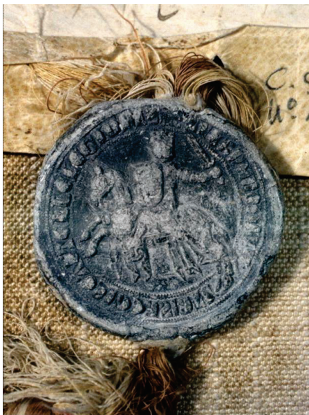
Reverso de un sello de plomo de Fernando IV de 1308 antes de la restauración. Número 111 de la colección.