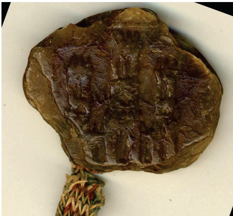
Sello de cera de Alfonso X de hacia 1255 hasta ahora desconocido.