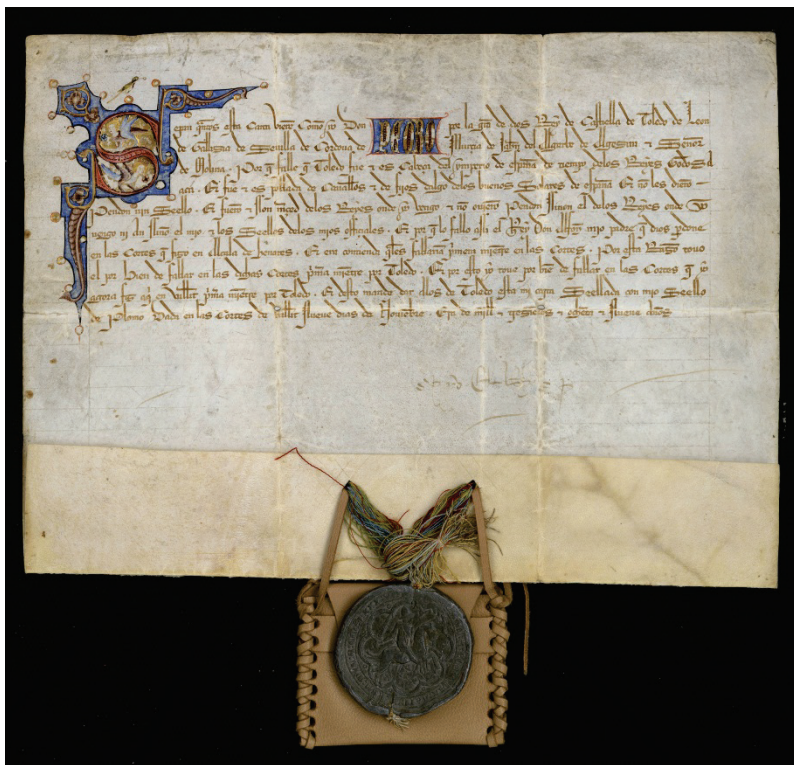
Carta plomada de 9 de noviembre de 1351.

Los libros de conocimientos nos reflejan la salida de los documentos del Archivo como pruebas en determinados procesos o para justificar derechos ante la Corona. Los que portaban sellos, al ser en su mayoría privilegios rodados, cartas plomadas o cartas de privilegio y confirmación, tuvieron un transcurrir ajetreado hasta entrado el siglo XIX pues solían ser los más viajeros al ser enviados de tarde en tarde a las Chancillerías, a los Consejos o a otros altos organismos de la administración central por los motivos señalados. Esas salidas implicaban riesgos que podían provocar su pérdida definitiva o la de algunos de sus elementos validativos, especialmente de sus sellos. Y la ciudad encontró muy