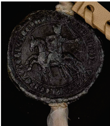
Reverso de un sello de plomo de Fernando IV de 1308 después de la restauración. Número 111 de la colección.