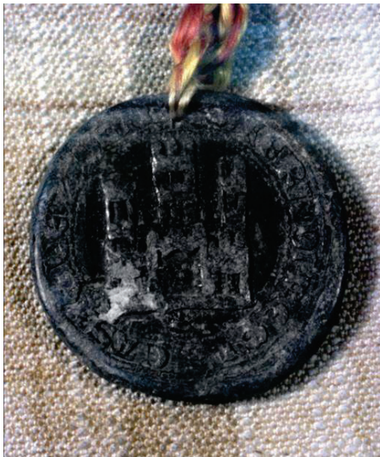
Anverso de un sello de plomo de Fernando III de 1243 antes de la restauración. Número 115 de la colección.