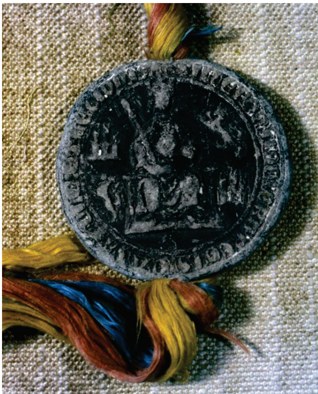
Anverso de un sello de plomo de Alfonso XI de 1333. Número 81 de la colección.

autor quien llevara a cabo o encargara las reproducciones conservadas en el Archivo Municipal de algunos de sus sellos, porque al antiguo “envoltorio” de sellos desprendidos se incorporaron por esas fechas varias reproducciones realizadas en alguna aleación metálica, de composición desconocida pero fácilmente distinguibles por su diferente color y por la inexistencia de cordones o hilos.